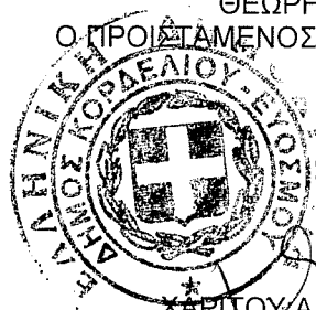
ΧΑΡΙΤΟΥ ΑΡΙΣΤΕΙΔΗΣ ΠΟΛ. ΜΗΧ/ΚΟΣ Π.Ε. Ημερ. 14/03/17